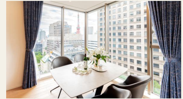
※リビングからの眺望