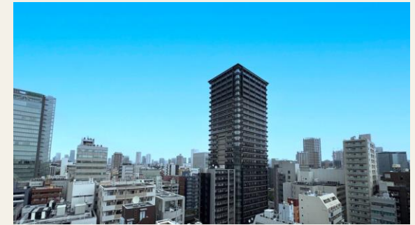
※バルコニーからの眺望