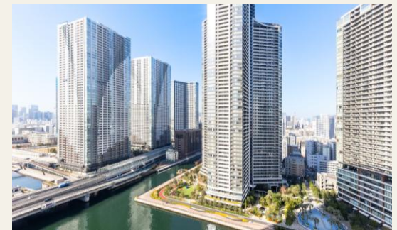
※バルコニーからの眺望