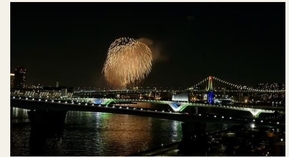
※バルコニーからの眺望