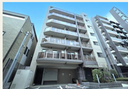
※建物外観(一部AI加工)