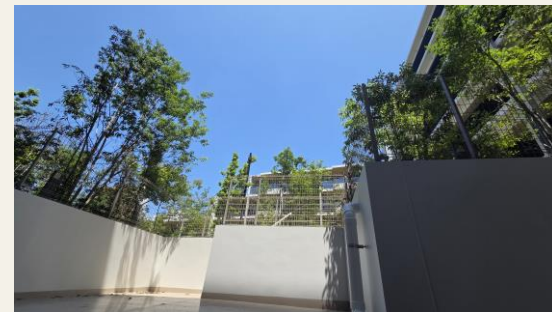
※リビングからの眺望