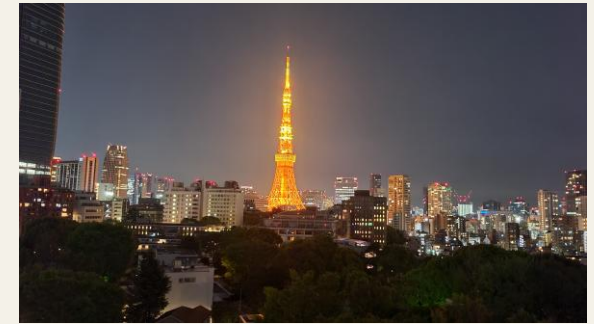
※屋上庭園からの眺望