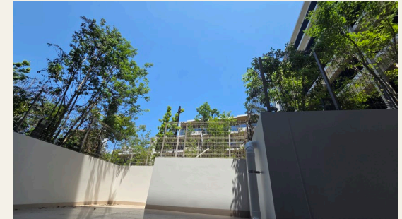
※リビングからの眺望