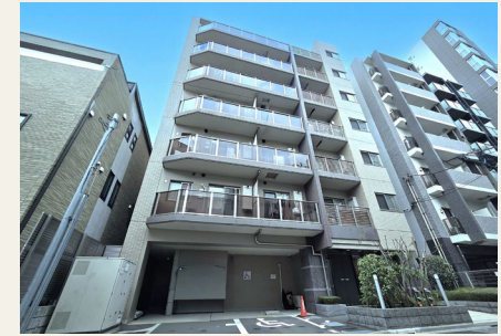
※建物外観(一部AI加工)