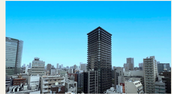
※バルコニーからの眺望