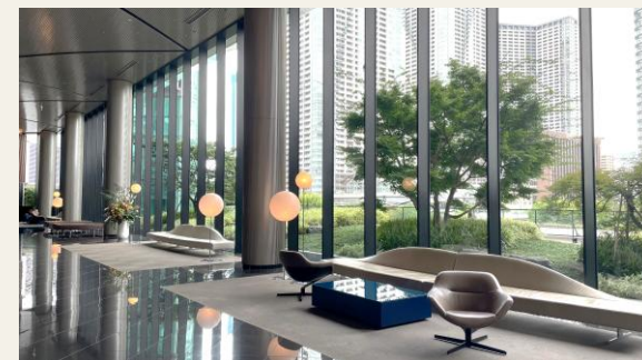
※エントランスホール