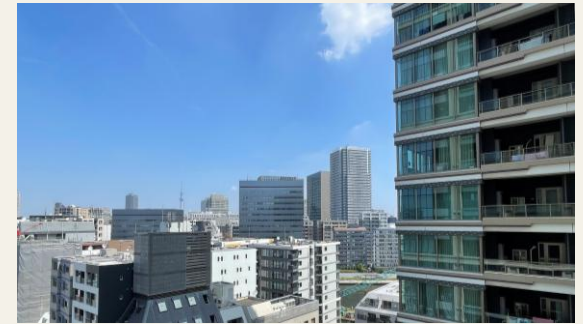
※バルコニーからの眺望