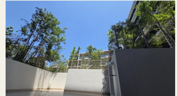
※リビングからの眺望