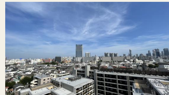
※リビングからの眺望