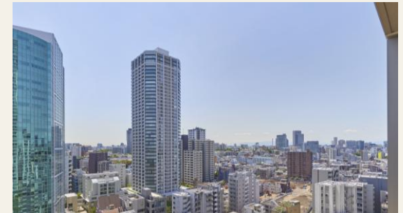
※リビングからの眺望