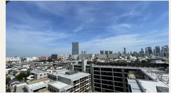
※リビングからの眺望