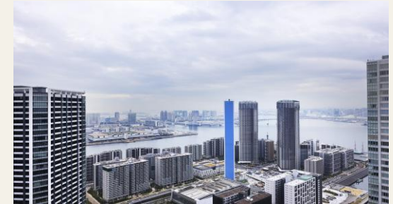
※リビングからの眺望