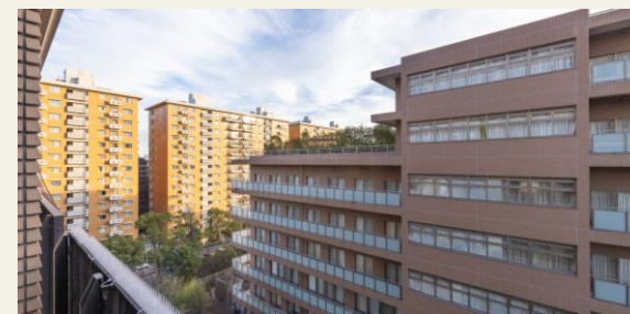
※リビングからの眺望