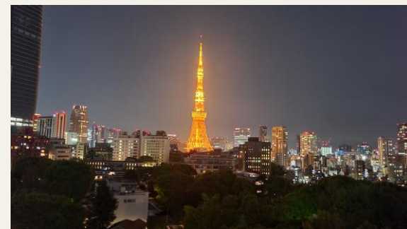
※屋上庭園からの眺望