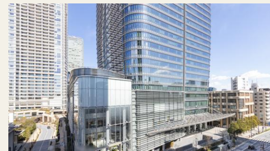
※リビングからの眺望