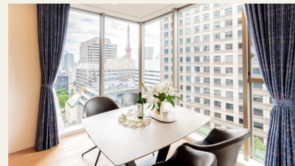
※リビングからの眺望